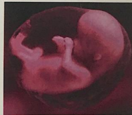
foetus van 8 weken

De enige manier waarop je ziel naar huis kan terugkeren, is door haar karma te balanceren. Het is de bedoeling dat je je schulden terugbetaalt aan iedereen die je gedurende al je levens iets hebt aangedaan. En om dat te kunnen doen, dien je op de juiste tijd en op de juiste plaats op aarde te zijn, zodat je in contact kunt komen met de mensen waarmee je karma hebt. Je kunt je levensschulden alleen afbetalen als je een lichaam bezit.